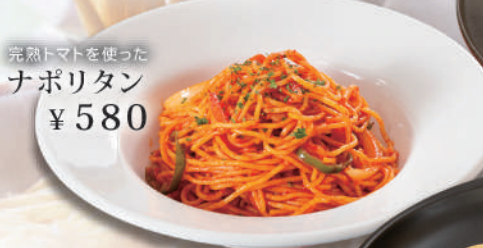
完熟トマトを使ったナポリタン ¥580