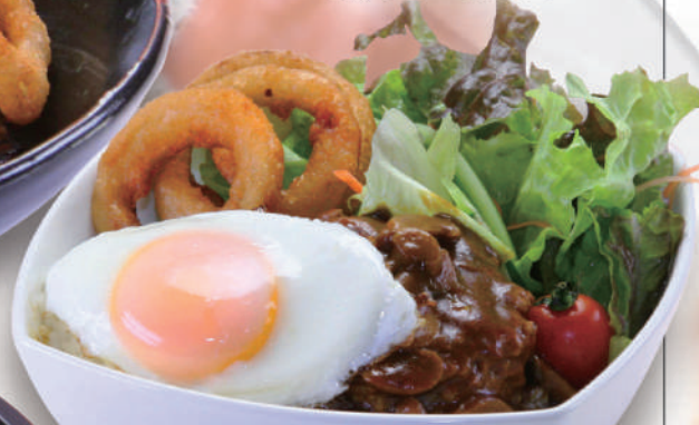
ハワイのローカル料理をアレンジ ハワイアンロコモコ ¥930