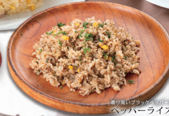
香り高いブラックペッパーのペッパーライス ¥550