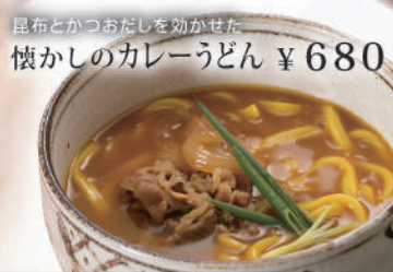
昆布とかつおだしを効かせた懐かしのカレーうどん ¥680