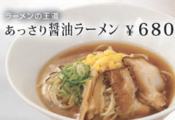
ラーメンの王道 あっさり醤油ラーメン ¥680