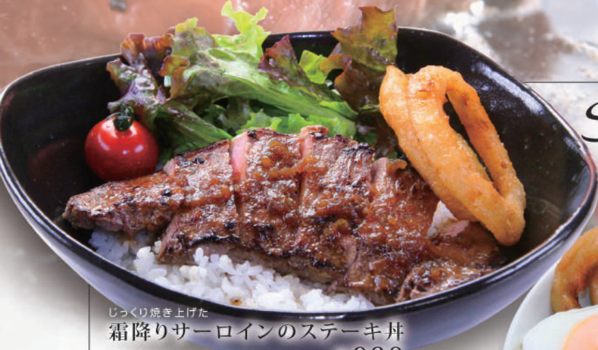
じっくり焼き上げた霜降りサーロインのステーキ丼 ¥930