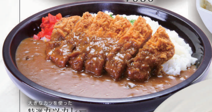
大きなカツを使った特選カツカレー ¥980