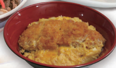
サクッと揚げたトンカツと卵のカツ丼 ¥780