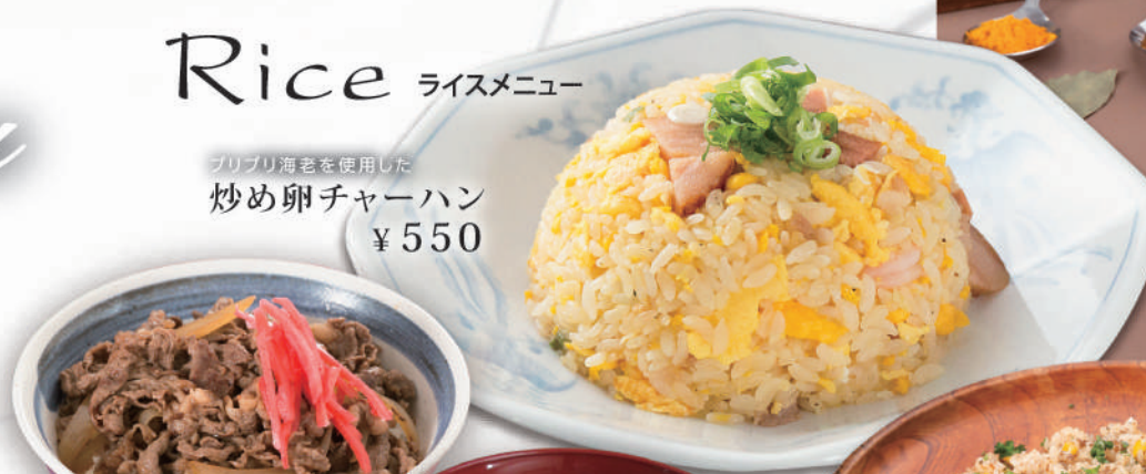
プリプリ海老を使用した炒め卵チャーハン ¥550