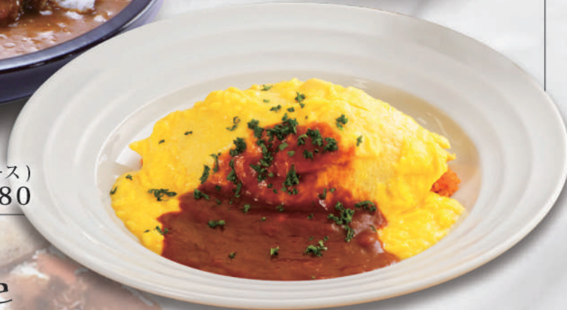
こだわりチキンライスとふわふわ卵のふわたろオムライス(デミソース) ¥780