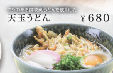
コシのある讃岐うどんを使用した天玉うどん ¥680