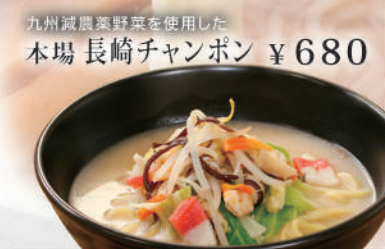
九州減農薬野菜を使用した本場長崎ちゃんぽん ¥680