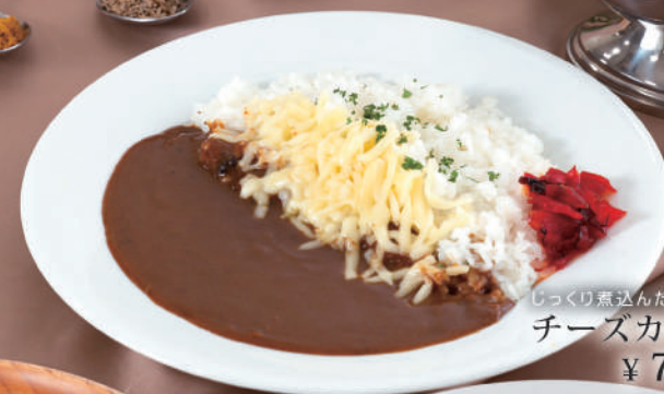
じっくり煮込んだチーズカレー ¥780