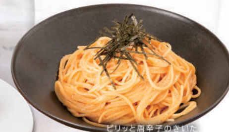
ピリッと唐辛子のきいた和風明太子パスタ ¥580