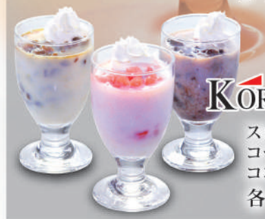
表面はカリッと中には蜂蜜がしみ込んだ熱々トーストと冷たいアイスクリュームがベストマッチ。 各 ¥680