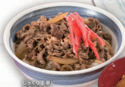
じっくり丁寧に炊き込んだ特選牛丼 ¥550