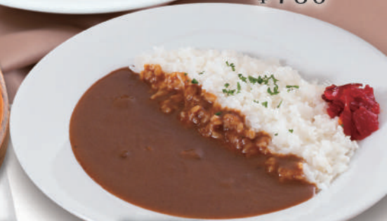
香り立ち豊かなこだわりビーフカレー ¥780